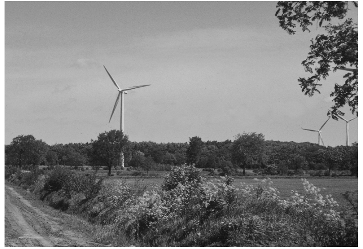
... und nach den Aufforstungsbemühungen