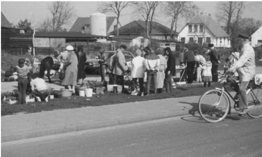
Pflanzenflohmarkt vor 22 Jahren am Mittelfeldweg