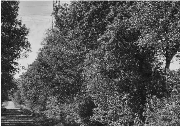
Alter Postweg vor der Abholaktion...