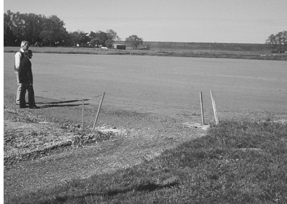
Sportplatz Weddewarden (Neubau)

über eine sportliche Nutzung des angrenzenden Gebäudes am Schulpfad in den Gremien der Stadt Langen und der Seestadt Bremerhaven nachdenken“, erläutert dieser weiter und fügt hinzu, „ein Abriss des Gebäudes wäre die schlechteste Lösung!“